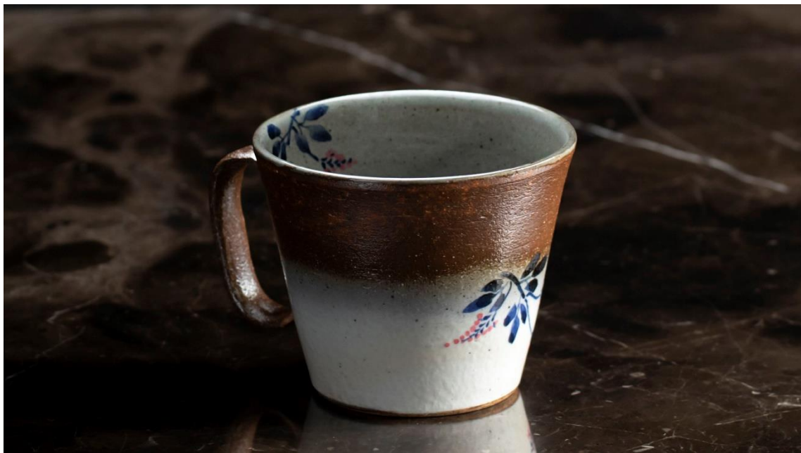
生涯を添い遂げるマグ 末家焼 レギュラー ミヤギノハギ